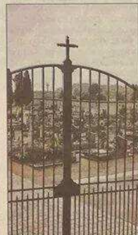
La croix qui suscite la polémique.

Ses contradicteurs s'étonnent de sa posture, indiquant la présence d'un signe religieux sur la tombe de son père. Lui dit ne pas voir le rapport : « J'ai même lu des textes bibliques pour ses funérailles. Attention », les invitent-ils, « à ne pas tout confondre. »