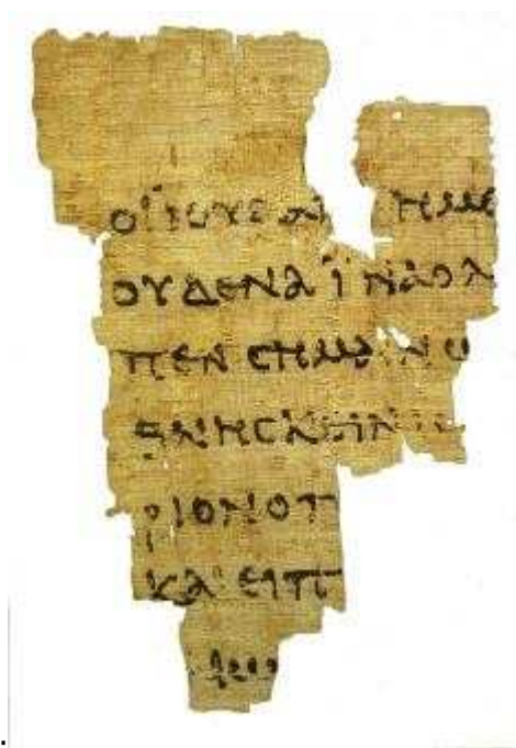
Manuscrit Rylands P52: