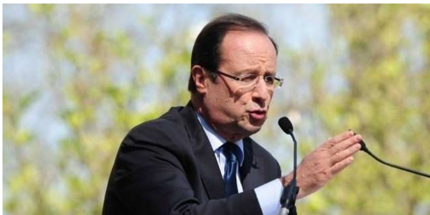
François Hollande, lors d'un discours à Tours

Mots-clés : présidentielle 2012, politique, Hollande, sarkozy, ps, ump