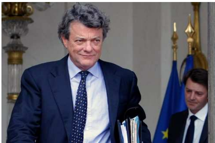
Jean-Louis Borloo, ancien ministre de l'Écologie

Mis à jour le 20/02/2012 à 09:03 | publié le 20/02/2012 à 07:22 Réagir