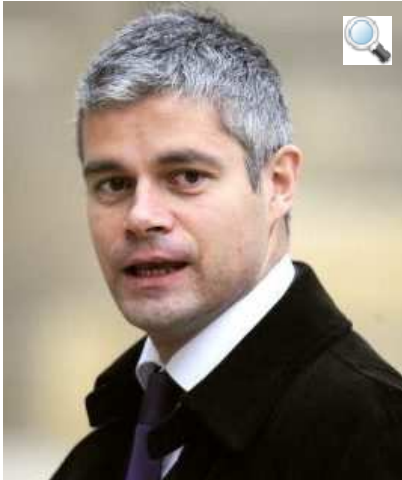
Laurent Wauquiez veut réserver les logements sociaux aux travailleurs